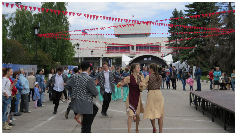
И банальные «шарики-фонарики» с фейерверком стали предметом жалоб.

О том, что торги проводятся неправильно, мы твердили три года - и не только на нашем сайте и ведомственных семинарах. Мы писали в правоохранительные структуры, в Министерство здравоохранения, главе региона, говорили, что есть признаки нарушения уголовного законодательства, накладывали штрафные санкции. В 2015 году мы оштрафовали 70 главврачей