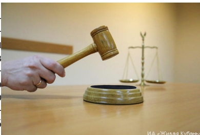
И.А. «Кивава Кубань»

Министерством лесного хозяйства, природопользования и экологии Ульяновской области в декабре 2012 года проводился конкурс на право заключения договора о предоставлении рыбопромыслового участка (16 участков) для осуществле-